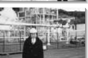
現場に足を運ぶことを大事にしています。