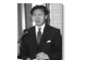
毎回、必ず質問に登場しています。

行財政の効率化へ 条例の導入を協議 や政策推進の推進 策定や執行など の推進に力を入れている の推進に力を入れている の推進に力を入れている