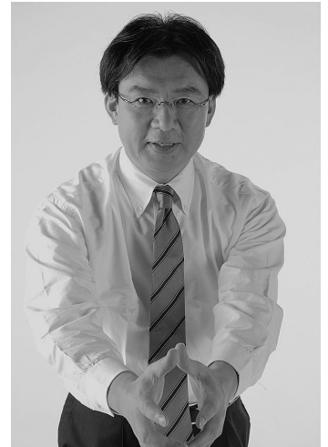
月曜朝7時～9時は駅頭で街頭演説を行っています!

しかし現実には、日本経済の国際競争力は年々低下しており、昨年の8位から今年には9位に下落するなど極めて深刻な状況です。やはりバラマキ型の予算措置ではなく、日本企業の成長力や国際競争力を高めるためのもっと大胆な戦略が不可欠であり、将来を見据えた選択と集中による思い切った投資を国を挙げて実施することが必要だと思います。例年12月は来年度の予算案や税制が決まる大事な時ですが、国益を踏まえてしっかり主張して参ります。