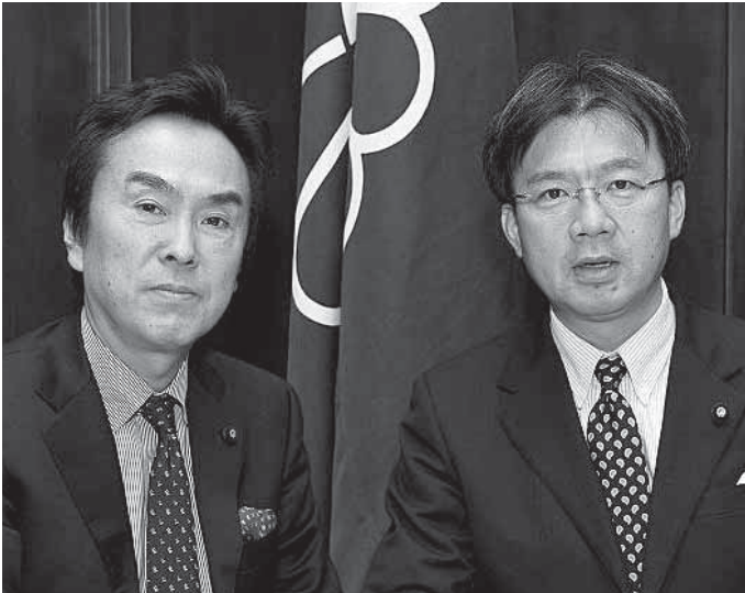
院内幹事室にて。副幹事長に留任した秋葉代議士。石原幹事長と