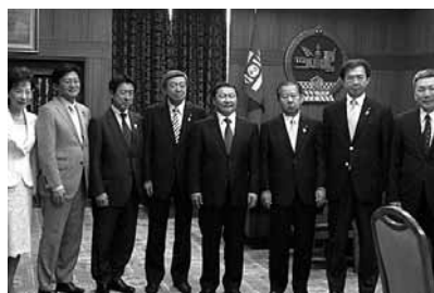
アルタンホヤグ首相と。