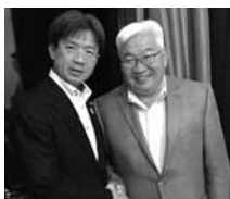
ウランバートル市長と