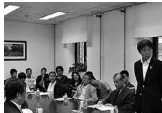
清華大学国際問題研究院・副院長の劉江永教授よりお招き頂き、清華大学キャンパスで秋葉復興副大臣が講演。