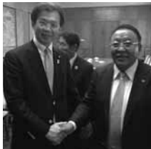
ガンホヤグ鉱業大臣と