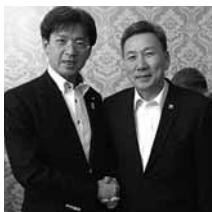
秋葉副大臣と同じ年のボルド外務大臣と。