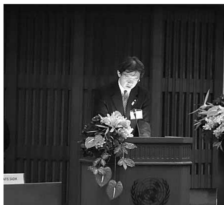
第6回アジア太平洋人口会議閣僚会合でスピーチを行う秋葉厚生労働副大臣