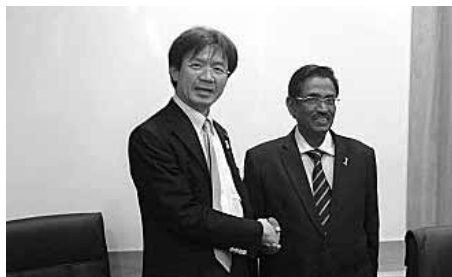
マレーシアのスプラマニア二保健大臣と。