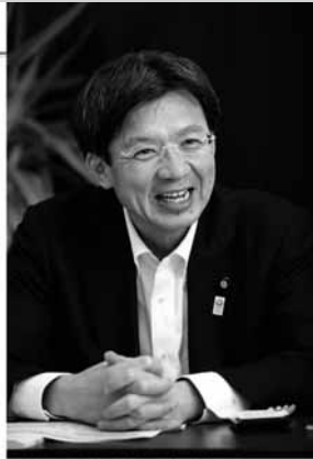
秋葉 賢也(あきば けんや) 1976年宮城県生まれ。中央大学法学部卒業。東北大学大学院法学研究科博士課程前期修了。松下幸之助(享年93歳)を経て、宮城県議会議員(3期)から、衆議院議員(4期)、「経済大臣政務官や文部科学大臣政務官を経て、厚生労働副大臣及び復興副大臣を歴任。

健康の話題 秋葉 賢也 厚生労働副大臣復興副大臣 早期発見・早期治療を心がけ、介護を必要としない。健康寿命をのばそう。ロコモティブシンドロームも要チェック。