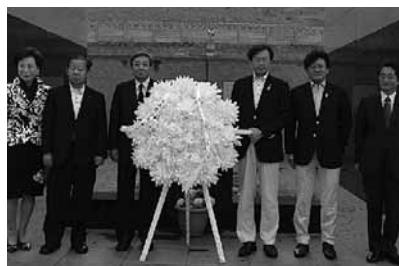
平成13年に建立された日本人墓地に献花