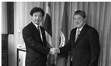
タイのブラディット保健大臣と会談。