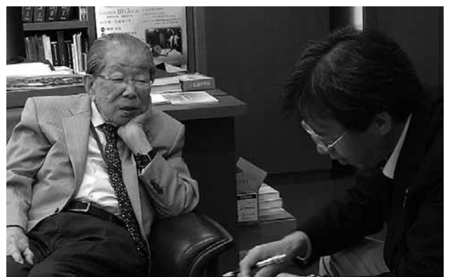
厚生労働副大臣 復興副大臣