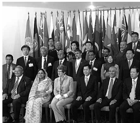
会議終了後、記者会見

47カ国から400人以上の代表団が集まり、タイのバンコクで開催された『第6回アジア太平洋人口会議』。今回の会議では、貧困の撲滅、性と生殖に関する健康と権利、HIV/AIDS、ジェンダーの平等、高齢化、移民や持続可能な開発等、幅広い問題を議題として、アジア太平洋地域における人口と開発の分野での成功、課題、今後の優先事項が検討され、『人口と開発に関するアジア太平洋宣言』が採択されました。