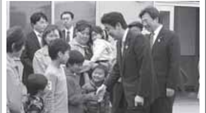
安倍総理と共に復興状況を視察