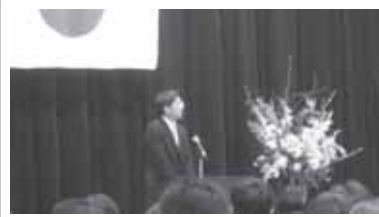
厚労省講堂で副大臣就任の挨拶