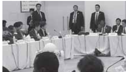
TICAD V でスピーチをする秋葉厚生労働副大臣