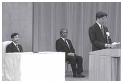
皇太子殿下ご臨席の下 ～献血運動推進大会～