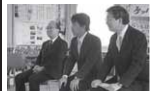
仮設住宅住民の皆さんと意見交換