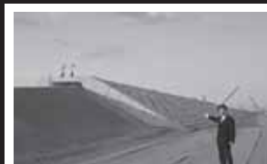
仙台湾南部海岸を視察