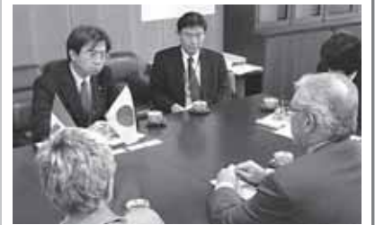
リッツ・カナダ農務農産食品大臣による表敬