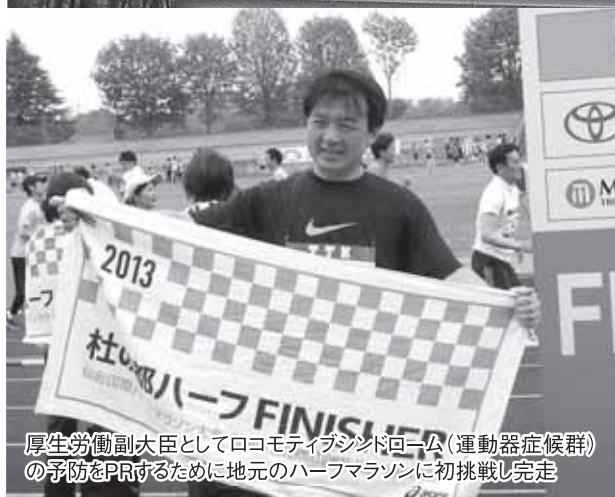
厚生労働副大臣としてロコモティブシンドローム（運動器症候群）の予防をPRするために地元のハーフマラソンに初挑戦し完走