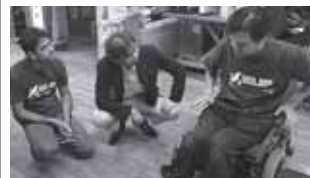
世界一小回りの利く電動の車いす を製作する「さいとう工房」を視察