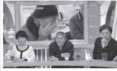
「ビートたけしのTVタックル」に出演