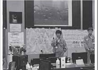
田村厚生労働大臣、秋葉副大臣 ～福島第一原子力発電所を視察～