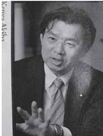
インタビューが掲載 「プレジデント4月号」