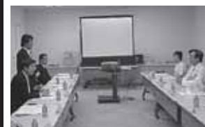
震災した石巻赤十字病院を田村厚生労働と訪問