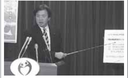
『インフルエンザ予防をよびかけ』記者会見