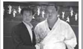
日本モンゴル議連によるモンゴル視 察に先立つ打合せで、横綱 白鳳関と