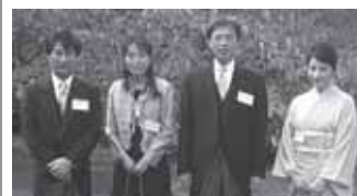
田村厚生労働大臣ご夫妻と