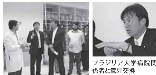
ブラジリア大学病院関係者と意見交換