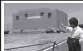
荒井東地区にて整備している災害公営住宅現場を視察