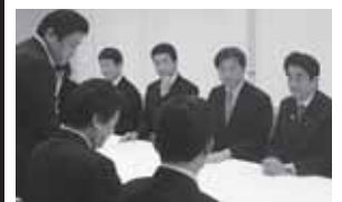
宮城県議の皆さんよりご要望を賜わる安倍総理と秋葉(前)副大臣