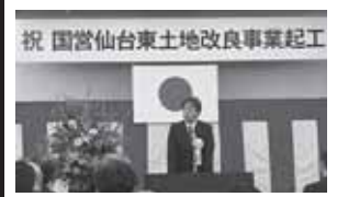
祝 国営仙台東土地改良事業起工式 国営仙台東土地改良事業起工式