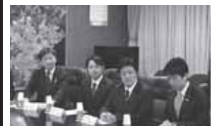
小泉進次郎青年局長(チーム11)と共に仙台市議の皆さんと意見交換