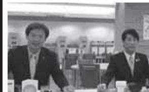
被災3県の水産物の美味しさをアピール【厚生労働省食堂にて】