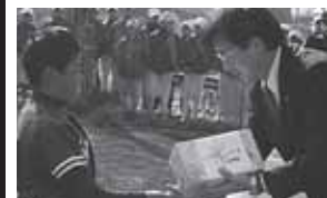
「リトルリーグ・マイナー大会」で選手たちを激励