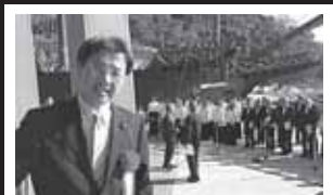
慶長遣欧使節400年記念式典に出席(サン・ファン館にて)

多くの皆様にご購読いただき心より感謝申し上げます。全国の主要書店やアマゾン等のインターネットでもお求めいただけます。