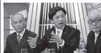
「ビートたけしのTVタックル」3回目の出演