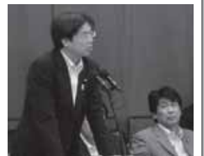
秋葉厚生労働副大臣による委員会答弁