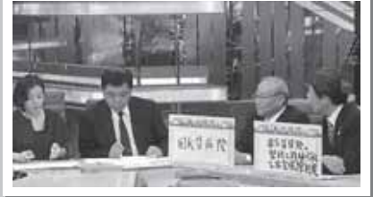
BSフジ『プライムニュース』に出演