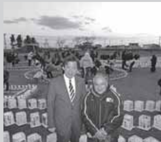
なとり復興プロジェクト主催「3.11関東追悼イベント2014」

震災から丸三年。昨年同様、今年も地元仙台市の追悼式に参列し、犠牲者の御霊に献花させて頂きました。必ず皆の笑顔を取り戻します。