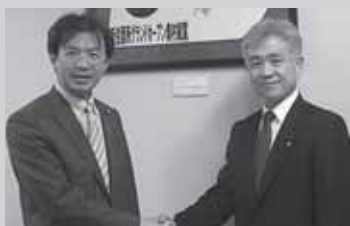
中央大学の同期生で、ランニング愛好家でもある秋葉委員長と奥村社長。