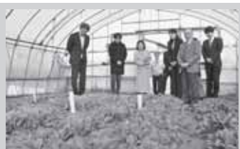
宮城野区の自然農法のハウス

「夢をかなえる復興に」 〇:「女性や若い人の視点を取入れたまちづくりをしてほしい」。安倍晋三首相の妻昭恵さんが26日、仙台市であった自民党衆議院議員秋葉賢也氏(宮城2区)の後援会会合であいさつした。約450人を前に東日本大震災の被災地へ進むまちづくりに対する思いを語った。 なびた被災地に入り、「巨大な防潮堤の整備に疑問を抱き掛けるなど独自の復興像を描く昭恵さん。」「若者の夢をかなえる復興のため、注目されるべきな復興になる。日本の象徴にしてほしい」と呼び掛けた。