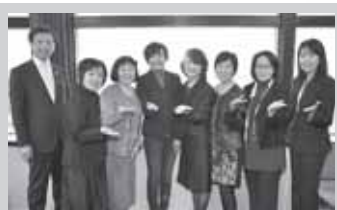
サロンドリーフの皆様と昼食会