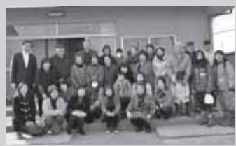
若林区笹屋敷地区住民の方々と懇談