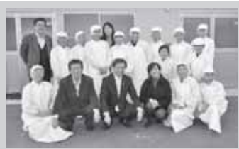
宮城野区の岡田生産組合