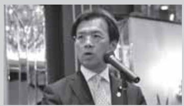
挨拶をする秋葉代議士