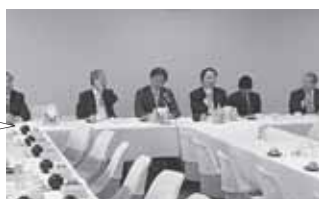
17日の副幹事を務める「 衛生検査所推進議連 」の総会に出席

『 検体検査法令改正案 』を議員立法として今国会に提出・成立を目指しております。