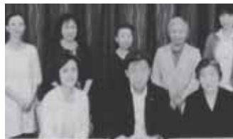
秋葉前厚労副大臣『RENMEみやぎ(第67号)』(宮城県看護連盟発行)より抜粋。

平成25年度末に完成し全176戸のうち4月末の時点ですでに172戸の入居が決定。