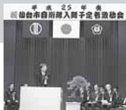
仙台市自衛隊入隊予定者激励会にて挨拶