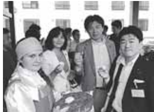
パンとお塩で歓迎