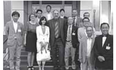
行政庁舎で意見交換