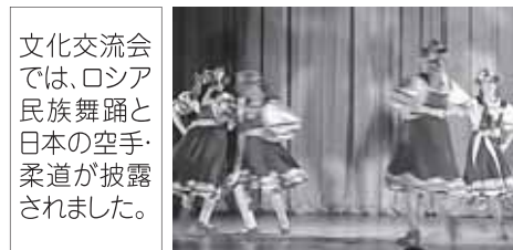
文化交流会では、ロシア民族舞踊と日本の空手・柔道が披露されました。