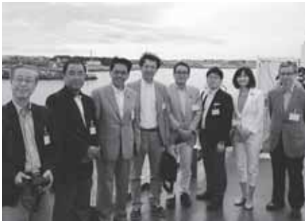
快晴に恵まれ「えとぴりか」に乗船し出航!