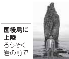
国後島に上陸 ろうそく岩の前で