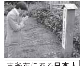
古釜布にある日本人墓地を参拝