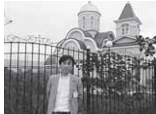
2年前に建てられたロシア正教会