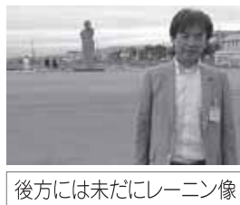
後方には未だにレーニン像