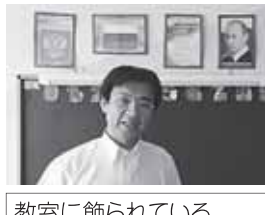
教室に飾られているブーチン大統領の肖像画