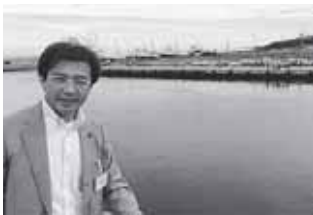
国後島を目前にして