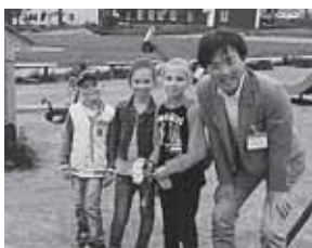
国後島の子どもたちと