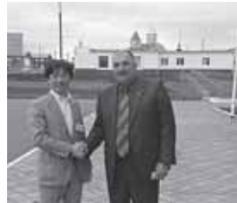
ソロムコ地区長兼行政長と