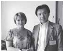
古釜布学校の校長先生と