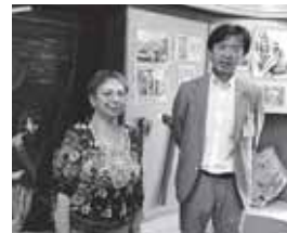
郷土博物館の館長と