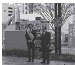
母校・中央大学OBである二階総務会長が仙台に、応援のためかけつけてくれました。