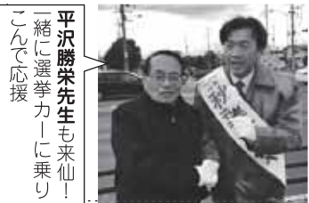
平沢勝栄先生も来仙!一緒に選挙カーに乗りこんで応援