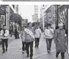
永井選対本部長と大勢のサポーターと共に『投票に行こう』と呼びかけ。