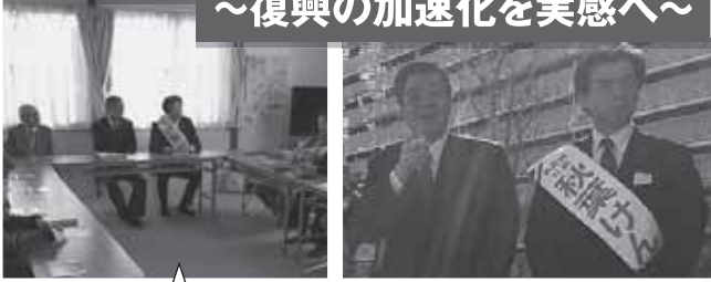
竹下復興大臣と共に、仮設住宅で被災者の皆さんから陳情を賜る。