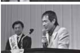
「総決起大会」には、村井知事、参議院議員の猪口邦子先生、丸山和也先生が応援に駆けつける中、450人もの皆様にご参集賜りました。