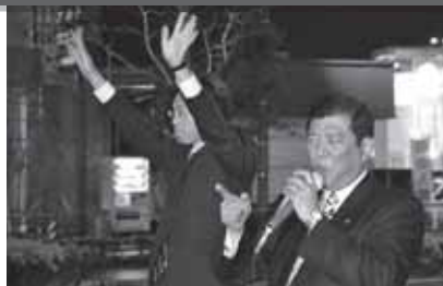
石破地方創生担当大臣、秋葉けんや後援会幹部と意見交換