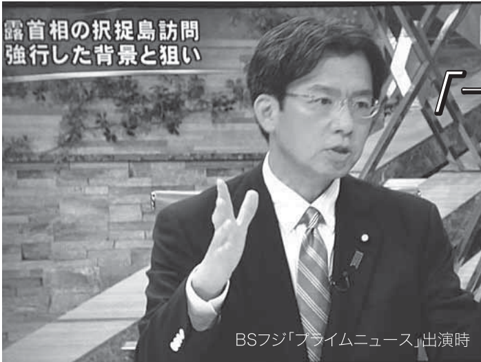
露首相の択捉島訪問 強行した背景と狙い