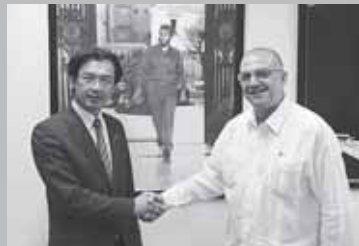
キューバ外務省のベルガラ二国間問題総局長代理と意見交換