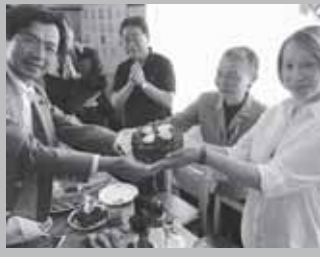
ヴィシロワ地区議会副議長よりパースデーケーキで誕生日を祝って頂きました。