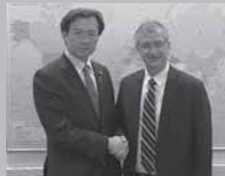
シトリット外務次官を表敬(イスラエル)