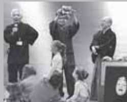
択捉島民との文化交流