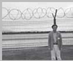
ロシアの実効支配が進む択捉空港を視察