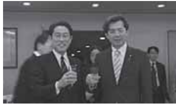
平成27年度外務省予算がほぼ満額回答を得たことで、岸田外務大臣そして秋葉外交部会長の顔には安堵の表情が見られました。