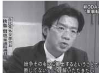
2月10日「報道ステーション」に秋葉外交部会長(当時)のコメントが放送されました。