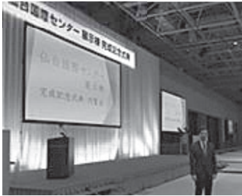
「仙台国際センター展示棟完成式典」に出席。