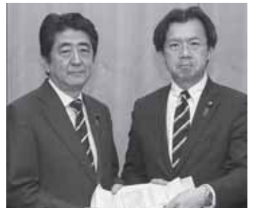
ODA検証勉強会の結果報告