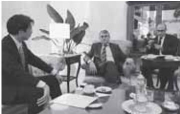
秋葉代議士は、トルコ国内での日本産食品・飲料の輸入制限措置の撤廃、輸入手続きの緩和を求め、メリチ駐日トルコ大使と意見交換致しました。