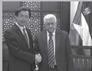
アッパース議長を表敬訪問(パレスチナ自治政府)