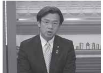
3月24日、BS日テレ「深層NEWS」に出演。