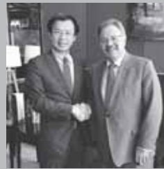
カントゥ下院外務委員長(メキシコ)と議会交流について意見交換