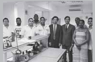
キューバにある「オリンパス内視鏡技術サービスセンター」を視察