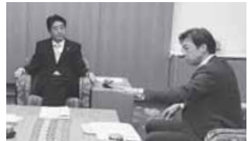
AIIBに関する党とりまとめを提出

自民党外交部会長として中東諸国を歴訪し、1月の安倍総理の中東訪問をフォローアップすることで中東諸国と我が国との協力関係の意義を強調すると共に、被災地復興を実現する為に日本産(被災地産)食品の輸入規制の解除や産地証明の義務の見直しを働きかけて参りました。