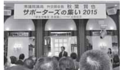
『厚生労働省改造論』出版を記念して「サポーターズの集い2015」をパレスへいあんで開催致しました。