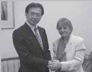
アブルナガ大統領補佐官と意見交換(エジプト)