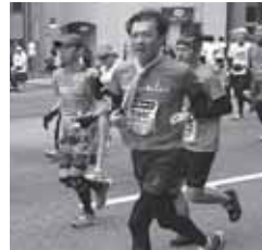
「東京マラソン2015」に出場し、52歳で念願のサブフォー達成!