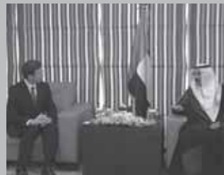
サバーハ第一副首相と懇談(クウェート)