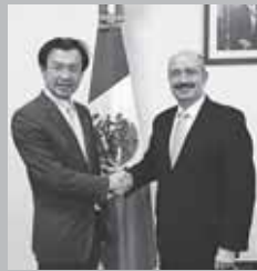
イカサ外務次官と懇談(メキシコ)

自民党の外交部会長として、外務省南米カリブ課長随行の下、メキシコとキューバを視察致しました。