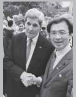
34年ぶりにキューバ米国大使館開設の記念レセプションにて、ケリー国務長官と。