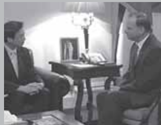
ファイサル王子を表敬(ヨルダン王国)