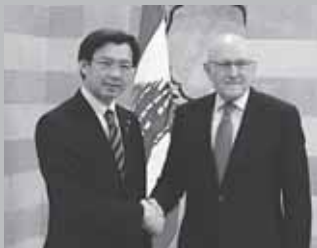
サラーム首相を表敬(レバノン)