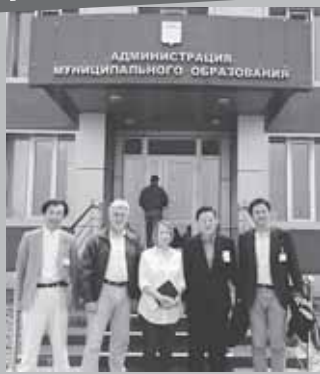
国後行政地区庁代表と意見交換