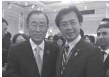
3月に地元・仙台で開催された「第3回国連防災世界会議」の政府主催レセプションの席で潘基文国連事務総長と。