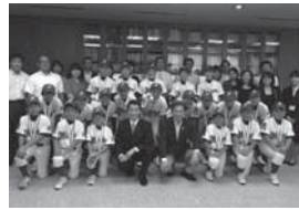
村井知事を表敬訪問