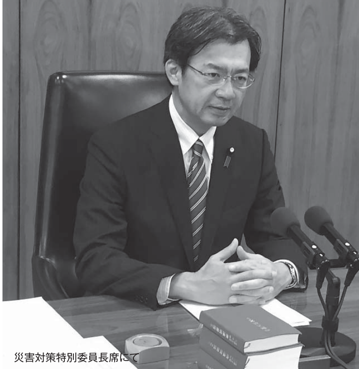
災害対策特別委員長席にて

この15年間でみると、大企業の数はいずれも減少していませんが、中小企業数は、103万社以上減少しました。そのほとんどが従業員数20人以下の「小規模企業」(商業・サービス業は5人以下)なのです。理由は様々ですが、必ずしも業績や売上の不振で倒産や廃業に追い込まれているのではないという実態にもっと着目する必要があります。近年、経営者の高齢化が急速に進展してきたことに加えて、後継者不足の問題で、スムーズに事業承継できずに、やむを得ず廃業せざるを得ない会社が増えてきているのです。