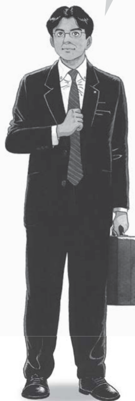
平成29年4月2日付 河北新報より