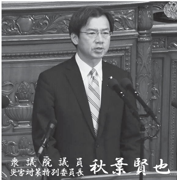
衆議院議員 秋葉賢也 災害対策特別委員長