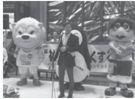
オープニングセレモニーで祝辞

7月は「社会を明るくする運動」の強化月間です。犯罪や非行の防止と罪を犯した人たちの更生について理解を深め、それぞれの立場において力を合わせ、犯罪のない地域社会を築こうとする全国的な運動です。秋葉代議士も国会の保護司議連の事務局長として毎年参加しています。