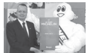
宮城のミシュランガイドの発行を 発表したペリニオ社長

ペリニオ社長は「宮城の食材と料理を評価し、訪日外国人旅行者(インバウンド)の拡充に向け態勢を整えてほしい。被災地の復興にも役立てば幸いだ。」と語ったそうです。是非多くの人に読んで頂き、宮城を訪れてほしいですね。