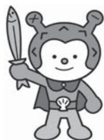
気仙沼市観光キャラクター「海の子ホヤぼーや」

生産量全国トップを誇り、宮城県を代表する海産物「ホヤ」。東日本大震災の影響により「ホヤ」の輸出先が減少し、国内販売に全力で取り組んでいます。消費しきれない「ホヤ」が大量に廃棄処分されています。お刺身でも火を通して美味しく食べられる「ホヤ」。食欲の秋には、ご家族で地元の「ホヤ」を食材にして食卓を囲ってみてはいかがでしょうか?