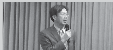
上映会の司会進行を務める秋葉事務局長