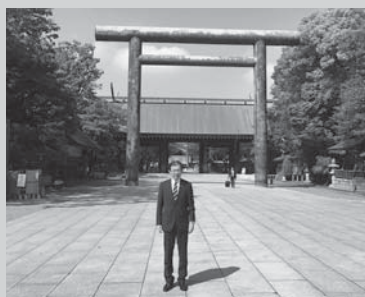
靖国神社は、来年創立150年を迎えます。