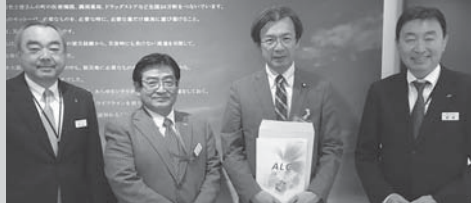
再生保護を考える議員の会・再犯防止特命委員会共催「君の笑顔に会いたくて」上映会