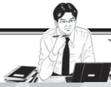
教えて! 秋葉環境委員長

* ③④について交付金算定割合は次の次の通り。 公立小中学校(1/3)、国立大学(1/2)、私立大学(1/3)