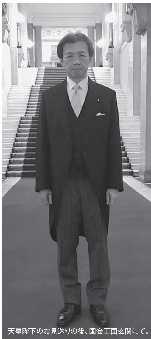
天皇陛下のお見送りの後、国会正面玄関にて。