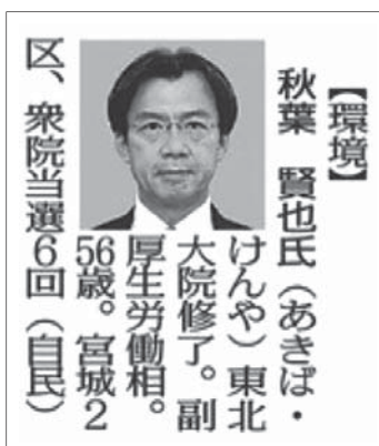
【環境】 秋葉 賢也氏(あきは・けんや)東北 大院修了。副 厚生労働相。 56歳。宮城2 区、衆院当選6回(自民)