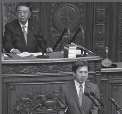
6日衆議院本会議に登壇し、法案の提出理由を説明する秋葉環境委員長