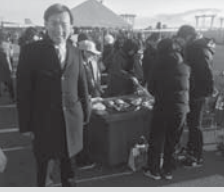
恒例の「仙台中央卸売市場初セリ」に参加