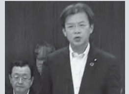
参議院環境委員会で法案説明