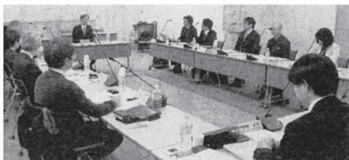
全世代型社会保障に関する広報の在り方会議。東京都千代田区で27日

在り方を検討したい。初会合では、議長を務める秋葉賢也首相補佐官があいさつした。会議は、安倍晋三首相から「全世代型社会保障を国民にわかりやすく伝えてほしい」との指示を受けた秋葉氏が設置した。民間から参加する委員10人は、